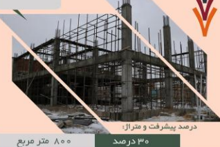
درصد پیشرفت و متراژ: ۸۰۰ متر مربع ۳۰ درصد