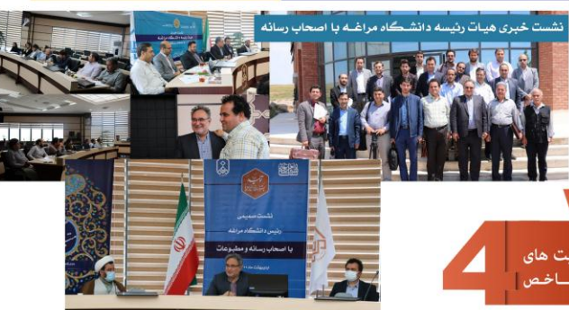
موفقیت بدون یک روابط عمومی خوب یک آرزوی بد است

روابط عمومی دانشگاه مراغه از مدتی با برنامه‌ریزی مدون در راستای مسئولیت اجتماعی خود اقدام به آغاز برخی فعالیت‌های خلاقانه نموده است و با مسئولیت این فعالیت‌ها به عهده روابط عمومی دانشگاه گذاشته شده است تا از این طریق نقشی خود را در توسعه دانشگاه و برنامه‌های شهرستان ایفا نماید. اکثر این فعالیت‌ها با هدف ارتباط تنگاتنگ با مسئولین شهری، متخصصین، فرهیختگان و اقشار مختلف جامعه می‌باشند.