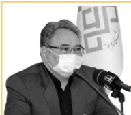
پیام تبریک رئیس دانشگاه مراغه بناسبت روز ارتباطات و روابط عمومی