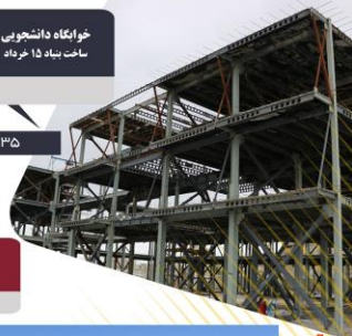
درصد پیشرفت و متراژ: ۵۸۰۰ متر مربع ۳۵ درصد