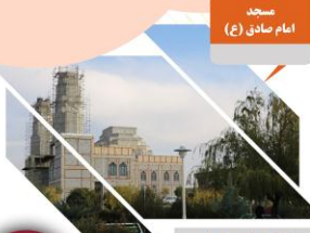
درصد پیشرفت و متراژ: ۱۵۰۰ متر مربع ۸۵ درصد