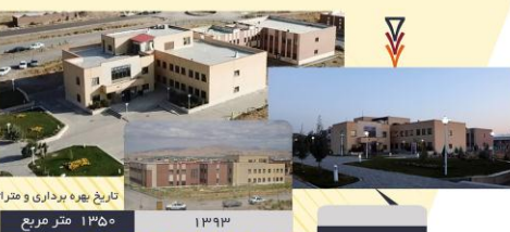
تاریخ بهره برداری و متراژ: ۱۳۹۳ ۱۳۵۰ متر مربع