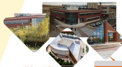
متراژ و درصد پیشرفت: ۵۵۰۰ متر مربع ۹۷ درصد