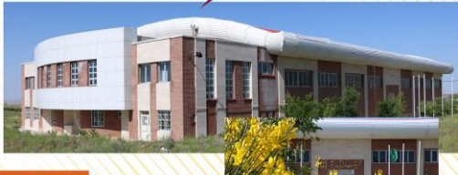
سال بهره برداری: ۱۳۹۴