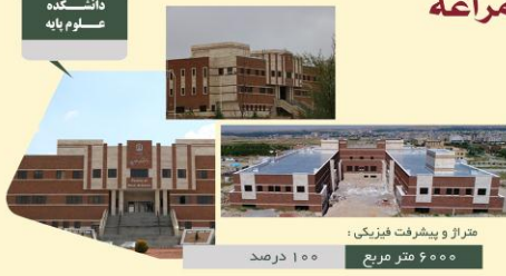
متراژ و پیشرفت فیزیکی: ۶۰۰۰ متر مربع ۱۰۰ درصد